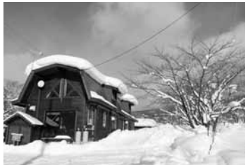
写真1：グランビアの生ハム工房

みなさんこんにちは。私は「グランビア」という生ハムのお店をやっていますが、今日は少しの時間生ハムのお話をしたいと思います。