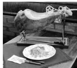
写真2：生ハムの原木

は、長期熟成されます。1年、または2年3年4年とかけます。これらの生ハムの違いの一つはつくる期間の長さです。もう一つの違いは、長期熟成タイプのハムは、無添加でつくるものが多いということです。