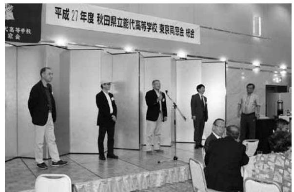
懇親会より、初参加者紹介の一場面。

この日から、今まで動くことのなかった私の中の能代高校という歯車が回りだしたように思う。「こてらんこ」での能代高校の48期同級生との