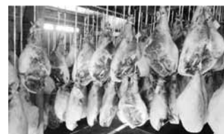
写真3：熟成中の生ハム

手前にある白いものは1年ものです。白っぽく見えるのは白カビです。白カビは製造過程の中で発生しま