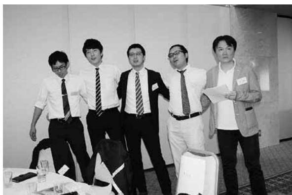
校歌斉唱の一場面。

東京同窓会に参加して、私の中で忘れかけていた「能代高校」という風、あの時代の感覚が蘇ってきた。能代高校での数々の経験が今の自分を作り上げていたことを実感した。