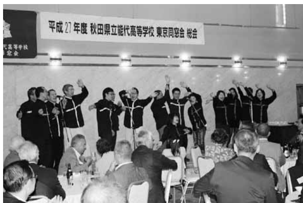
年々進歩を見せる松陵クワイヤのゴスペル。

飲み会に参加し、久しぶりに能代高校の風を感じる事になった。上野での2次会の帰りに「能代高校っていい高校だったんだね。」と言ったのを今でも覚えている。居心地のいい時間だった。