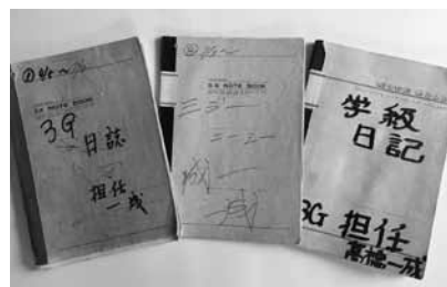
中身公開は10月1日の懇親会で!

読み返してみると、クラスメイトがこの日誌にかけの情熱の並々ならぬ大きさに驚きます。