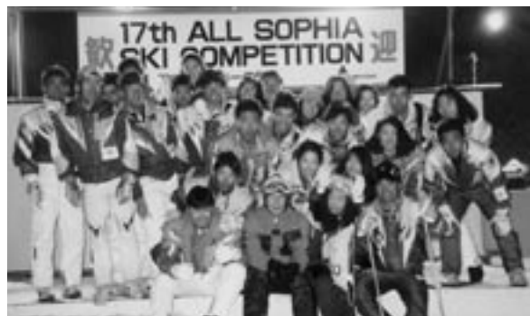
上智大のスキークラブの集合写真(東山スキー場にて)。最前列中央、ヤッケの老教授が私(1993年3月、61歳のとき)。

筆者は昭和24年度スキー部主将、上智大学名誉教授、上智大学アспен・スキークラブ名誉顧問(20年くらい顧問兼コーチ)。学内スキー大会では回転と大回転の前走をやっていた。