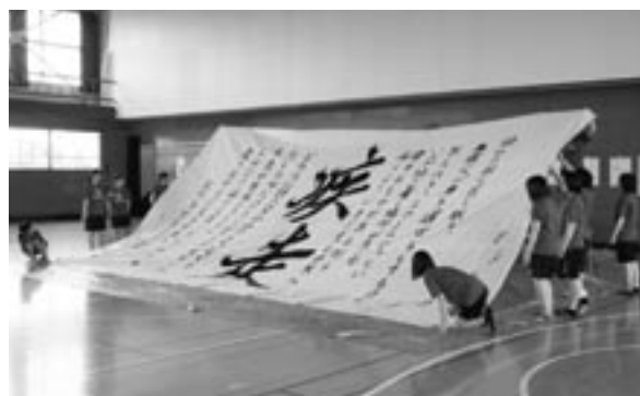
能高祭、書道部の「書道パフォーマンス」(第1体育館)

全校生徒の能高祭にかける思いが梅雨を吹き飛ばし、燦々と輝く2日間となったのだと思います。来年もまた能高の伝統を受け継ぐ素敵な能高祭になることを祈ります。