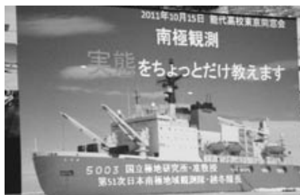
ビデオで約5分の南極観測紹介も

氷から露出した岩には植物(コケや藻)があります。地球ができてからおおよそ50億年。生き物が水の中で生活しだしたのは30億年前、陸上に出てきたのが5億6千万年前、恐竜は1億年前、人間は20万年前から。地球の環境変化がある中で生き物は環境に合わせて生存してきた。南極では氷期が終わり温かくなって氷が溶けた所に湖ができた。その水の中には植物がすみ始めている。こうした湖は新しいため(1万年ぐらい前)動物たち(魚)はいない。植物が環境を整え、動物たちが生まれてくる。地球の流れと同じようなことが、