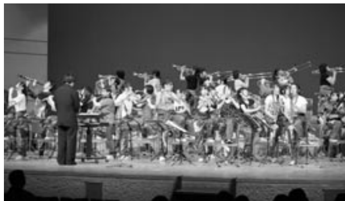
現役生が制服から衣装を替えて、第2部のパフォーマンス

後半はOB・OGが加わってのスペシャルバンドのステージ。最初は1980~90年代に人気を