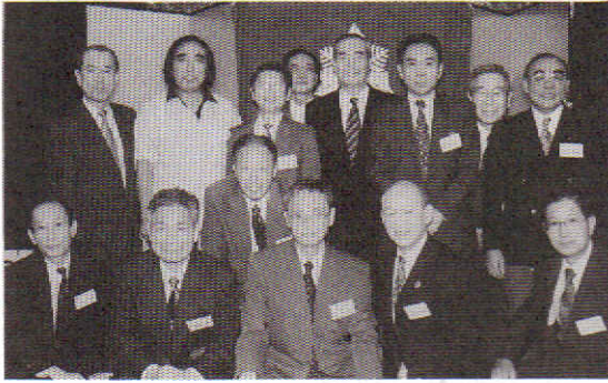
新 11 期生