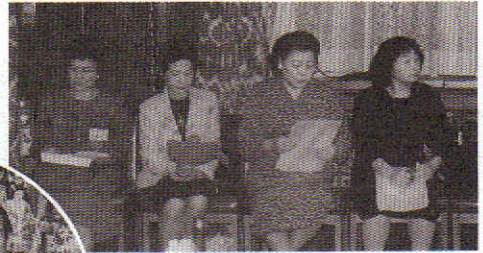
← ↑ ご来賓の方々 (北高、商業)