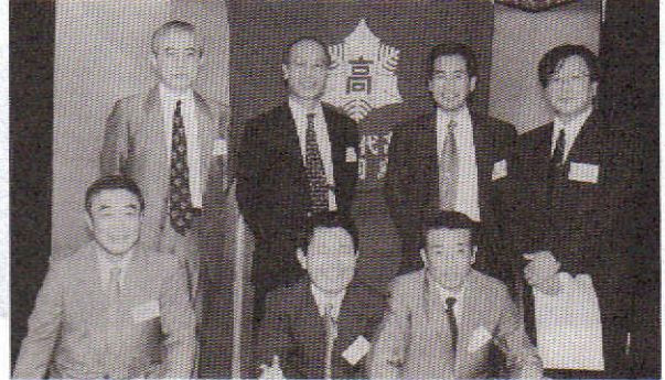
新 14 期生