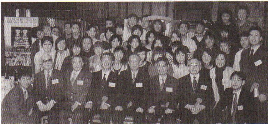
校長、会長、諸先輩を囲んで新卒者一同