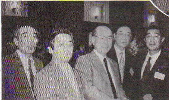
宮腰市長と同期生の新 5 期生