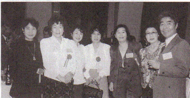
正真正銘の秋田美人に会えた