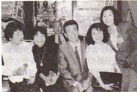
沢山の新しい人脈できました！

いろいろの分野で活躍されておられる先輩、後輩のたくさんいるこの能代高校東京同窓会にどうぞ参加して沢山の人脈を作ってください。知人、友人、親友が沢山いるということは人生で最高の財産ですよ。