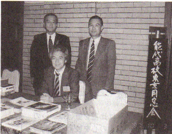
受付ご苦労様です