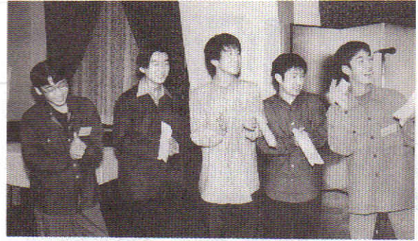
とっても明るい新卒者