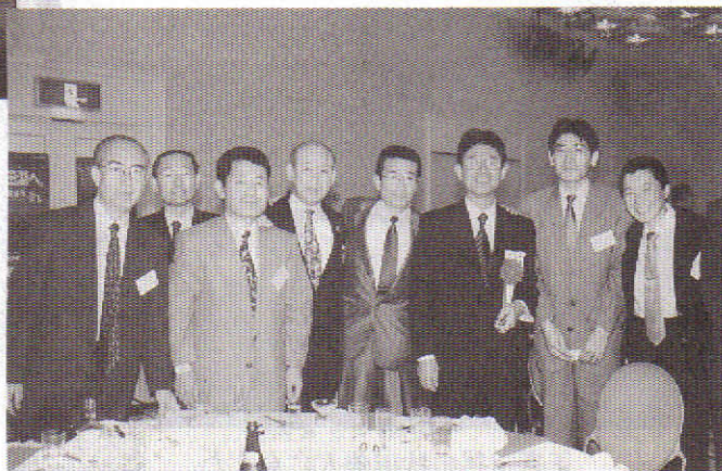
秋高連総会に出席した能高役員、幹事 (平成10年7月15日)