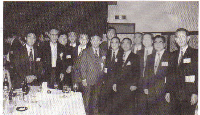
懐しい同窓生にも会えました