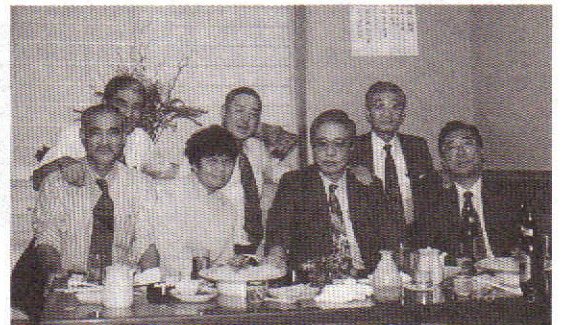
そのあとの二次会です