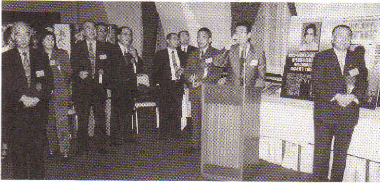
これから懇親会です